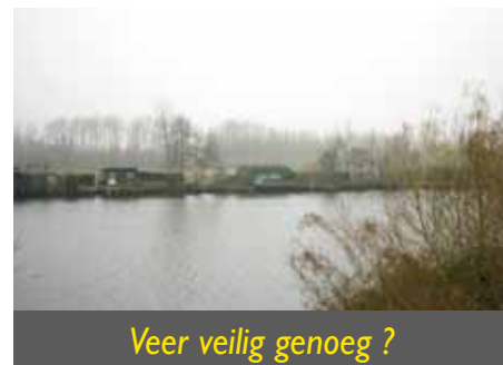
Veer veilig genoeg ?

Uit vergelijking met andere rockfestivals is dit vrij laat. De meeste sluiten af om 1 of 2 uur, of zelfs nog vroeger. Vanuit de vaststelling dat met een afsluitingsuur van 1 uur of vroeger de bewoners nog een deel van hun nachtrust hebben en vanuit het feit dat een vroeger afsluitingsuur blijkbaar helemaal de pret niet bederft, vroeg het Vlaams Belang om dit ook in Puurs te vervroegen. Het gemeentebestuur zou dat "evalueren". Nogal vaag. Wel duidelijk was het dat een verdere uitbreiding in omvang van Pukemarock niet echt tot de mogelijkheden behoort.