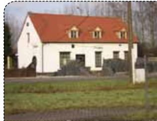
Liever geen goktent in Bornem

geld toezicht moeten houden. Dat gebeurt natuurlijk op kosten van de belastingbetaler en ten nadele van de veiligheid van de gehele gemeenschap. Volgens het gemeentebestuur heeft de politie nochtans geen bezwaar gemaakt. Een schriftelijk advies daarover was er in het dossier evenwel niet terug te vinden.