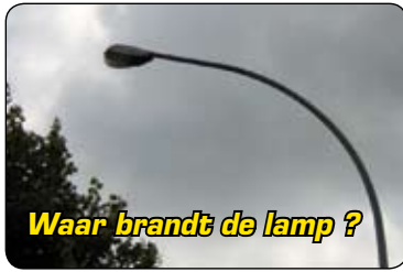
Waar brandt de lamp ?

Het gemeentebestuur wil in de eerste plaats nagaan of er langs de invalswegen op verlichting kan bespaard worden. IGEMO moet daartoe een verlichtingsplan opstellen. Wim Verheyden maakte op de gemeenteraad de bedenking dat daartoe één invalsweg als testzone zal worden gebruikt en blijkbaar moet dienen als basis van een verlichtingsplan voor alle grote invalswegen. "Ik ben