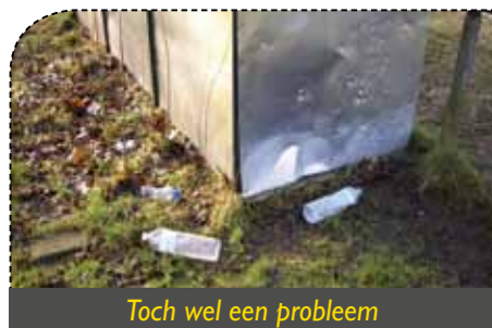
Toch wel een probleem

Toen we dit ter sprake brachten op de gemeenteraad van april, reageerde het gemeentebestuur eerder koel. De toestand was uiteindelijk niet zo erg en ten opzichte van vroeger is er vooruitgang geboekt, klonk het. Maar wat lezen we in het verslag van de sportraad van 26 april? "Opnieuw is er een sterke vervuiling in het domein waargenomen. Blikjes, plastic flessen, etensresten, noem maar op, ... blijven op verschillende plaatsen liggen. Nadars, die werden gebruikt voor het Paastornooi KSV Bornem op zaterdag, lagen zondagmorgen in de struiken en lagen her en der verspreid op de wandelwegen ter hoogte van de skate-ramp"