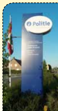
Eindelijk een probaat middel?

menten zullen worden georganiseerd in de drie gemeenten van de zone. In januari woonde een afvaardiging van de zone een voorlichtingsvergadering bij in Dendermonde. Veel investeringen vraagt dit niet voor de politie, alleen de UV-apparatuur. De aansluiting van de politie op de databank kost slechts 40 euro. De aankoop van SDNA-kits door de particulieren kost wel ongeveer 90 euro, maar het provinciebestuur is in bespreking met de leverancier om na te gaan of een gezamenlijke aankoop die prijs kan drukken. Bovendien zou de provincie mogelijk overwegen om de aankoop door inwoners te subsidiëren. De introductie van inbraakbeveiliging door middel van synthetisch DNA is dus alleen nog een kwestie van tijd. Al hopen we dat het deze keer niet zolang duurt als voor het provinciaal initiatief inzake gevonden fietsen.