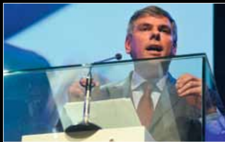
Filip Dewinter: "Naast inburgering moet de klemtoon ook op terugkeer liggen."