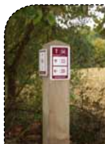
Toeristische troeven uitspelen

de in dat verband dat jaarlijks aan de hand van knooppunten, een nieuwe wandeling of fietstocht zou worden samengesteld rond een bepaald thema, een zoektocht, een wedstrijd of iets dergelijks, zodat aan toeristen elk jaar een nieuwe stimulans wordt aangeboden om naar Klein-Brabant af te zakken.