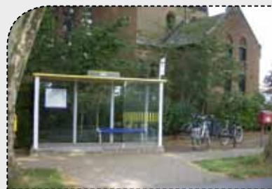
Zo moet het