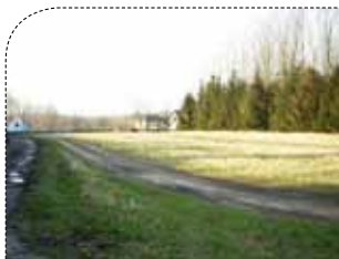
eindelijk wat realisme