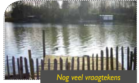
Nog veel vraagtekens

mogelijk misbruik. En waarom niet? Een en ander kan tot gevolg hebben dat de premie voor de verzekering vrij hoog zal liggen. Hoe hoog, ook daar kon het college nog niet op antwoorden.