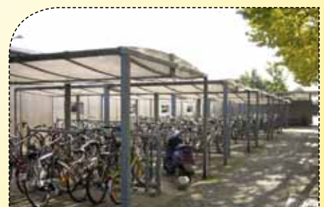
Laat je niet bestelen

blijkt dat een derde van de stationsbezoekers zich soms of altijd onveilig voelt, en dat 35% resp. 29% ooit direct slachtoffer of getuige geweest is van een crimineel feit. Spijtig dat het gemeentebestuur weigerachtig staat tegenover het plaatsen van camera's. Op zijn minst moet de mogelijkheid worden geboden om fietsen in fietskluizen weg te bergen.